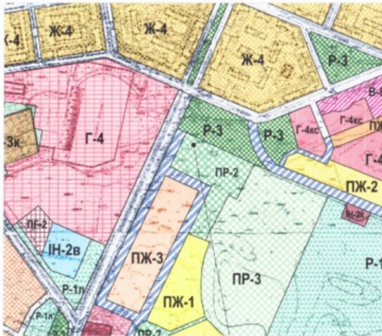
Місце розташування об'єкта